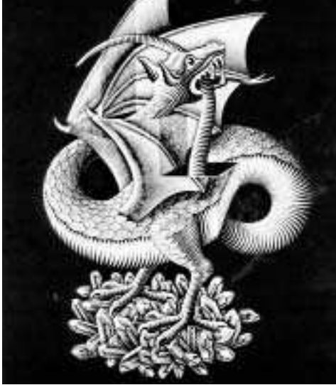
◀ Μ. Κ. ΕΣΕΡ. Δράκος: Ξυλογραφία.

Δεδομένου ότι η ηθική και η πολιτική συνιστούν σφαίρες, πλευρές της ζωής της κοινωνίας, έπεται ότι η κατανόησή τους και η κατανόηση της αλληλεπίδρασής τους εξαρτάται ουσιαστικά από την κατανόηση της κοινωνίας και της ιστορίας της. Θεμελιώδης όρος, και μάλιστα καθοριστικός ως προς την κατεύθυνση όλης της παρελθούσας και τρέχουσας ιστορίας της ανθρωπότητας, η οποία ανέκυψε από τη φύση με φυσικό τρόπο, ήταν η ανάγκη για ικανοποίηση εκείνων των βιολογικών αναγκών που ήταν απαραίτητες για τη ζωή (της τροφής, της προστασίας από δυσμενείς είτε επικίνδυνους όρους, της άμυνας από επιθέσεις, κ.ο.κ.). Στο βαθμό που γίνονταν διακριτοί από την υπόλοιπη φύση, από τον υπόλοιπο κόσμο των ζώων,