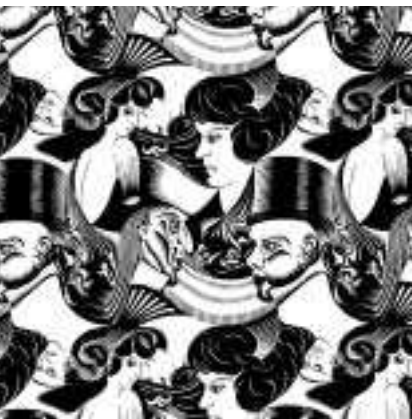
▲ Μ.Κ. ΕΖΕΡ. οκτώ κεφάλια, ξύλογραφία, 1922.

Η πολιτική συνιστά τη συμπυκνωμένη έκφραση του αγώνα των ανθρώπων για τις πραγματικές δυνατότητες, για τα πραγματικά μέσα ικανοποίησης των ζωδών, των βιολογικά απαραίτητων αναγκών.