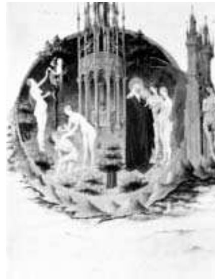
▲ Αδάμα και Εύα. Μουσείο Κοντέ.

Μπορούμε να διαιρέσουμε όλη την ιστορία της ανθρωπότητας σε δύο εποχές: στην προϊστορία της αυθεντικής ιστορίας της ανθρωπότητας και στην αυθεντική ιστορία της ανθρωπότητας.